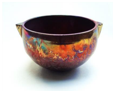
Gianbattista Ferraglio