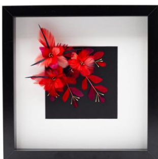
AnaGold © AnaGold