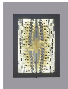
Alain Vilatou