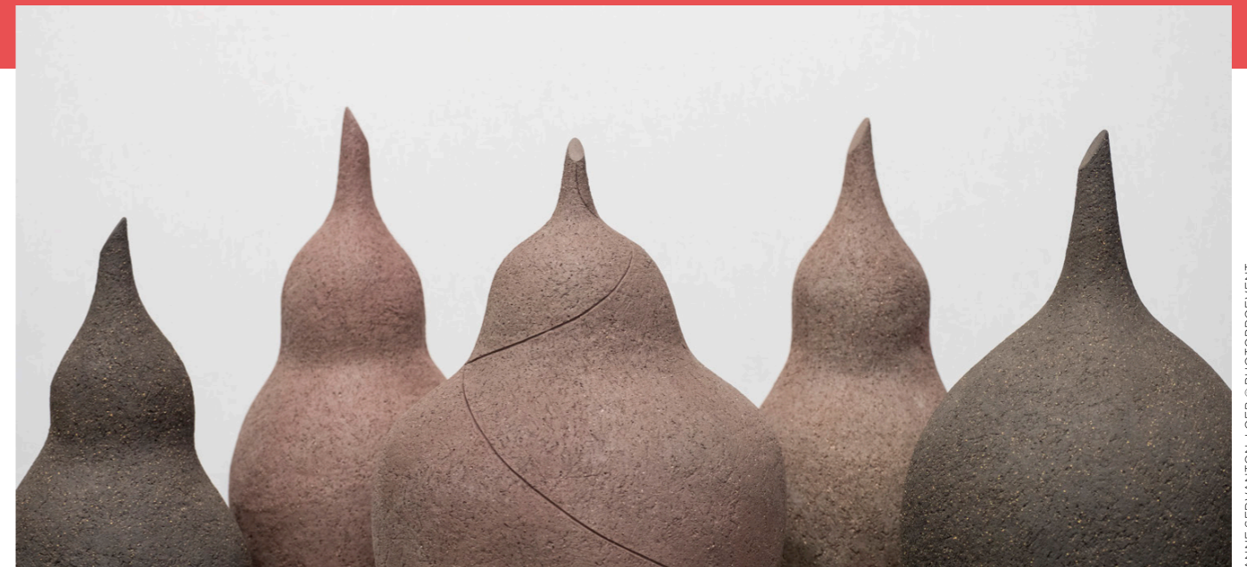
ANNE SERVANTON-LOEB © PHOTOPROEVENT