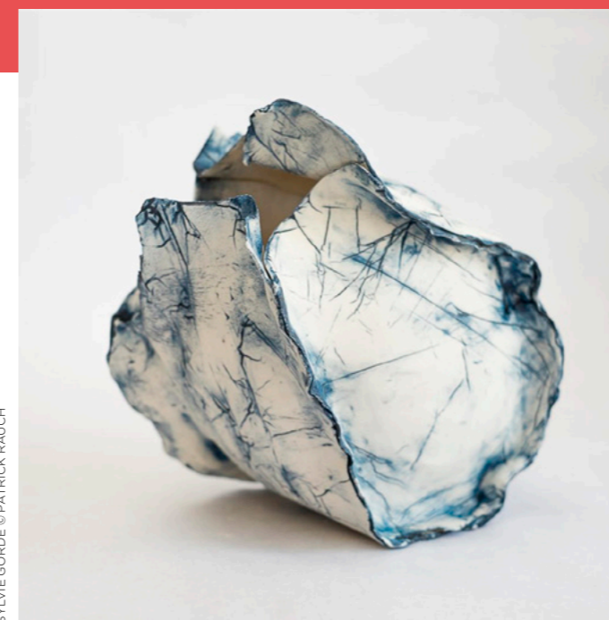
SYLVIE GORDE © PATRICK RAUCH