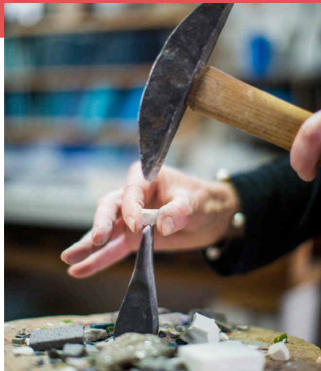
SUZANNE RIPPE