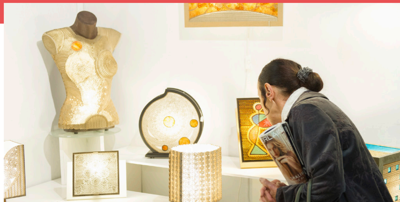
LAURENCE MEUZERET © PHOTOPROEVENT