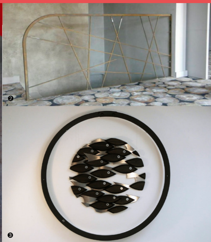
1 © DR 2 © DR 3 © DR