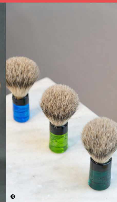
1 © LAURENT ELSA 2 © SUZANNE RIPPE 3 © PHOTOPROEVENT