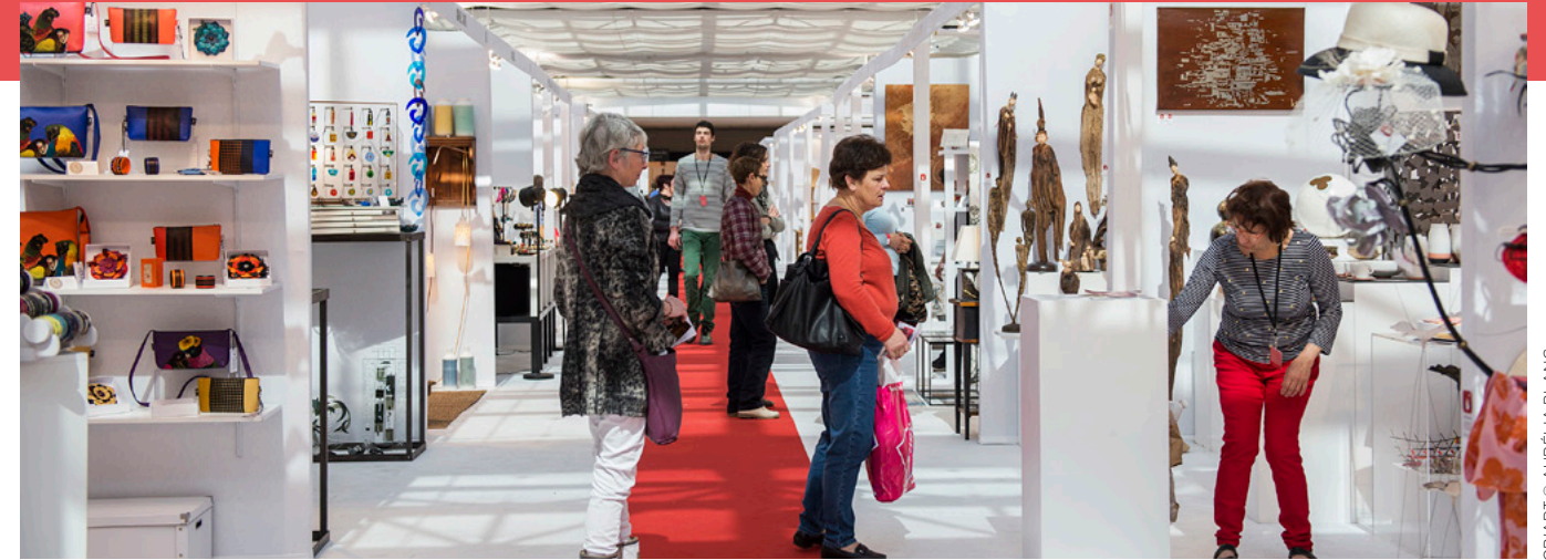
OB'ART © AURELIA BLANC

Maire de la Ville de Montpellier, Président de Montpellier Méditerranée Métropole.