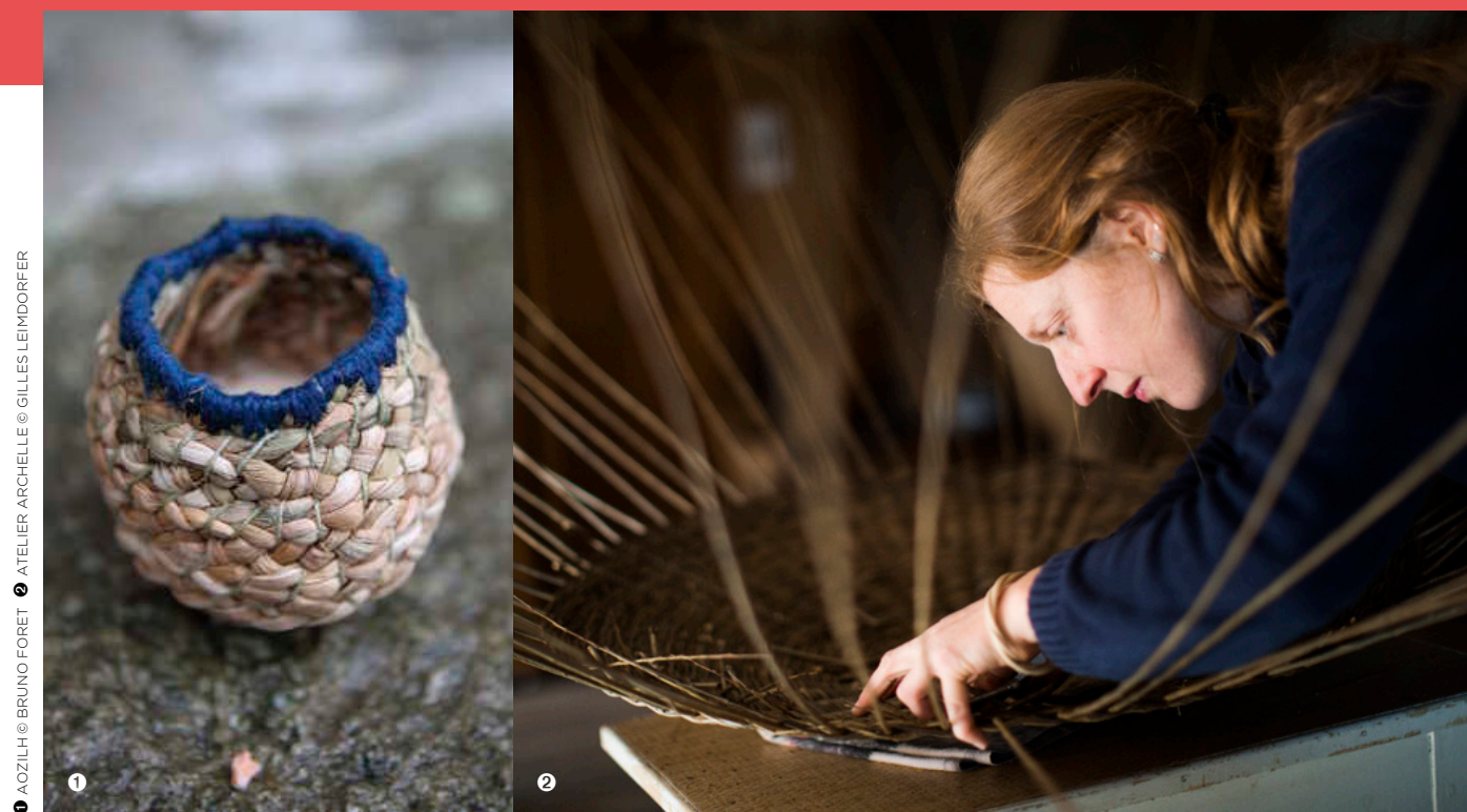
1 AOZILH © BRUNO FORET 2 ATELIER ARCHELLE © GILLES LEIMDORFER