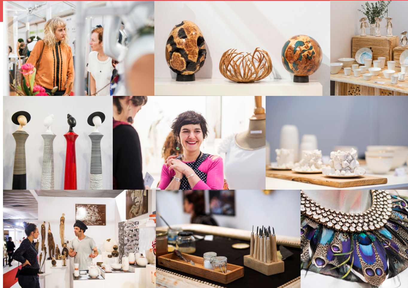
OB'ART © AURELIA BLANC